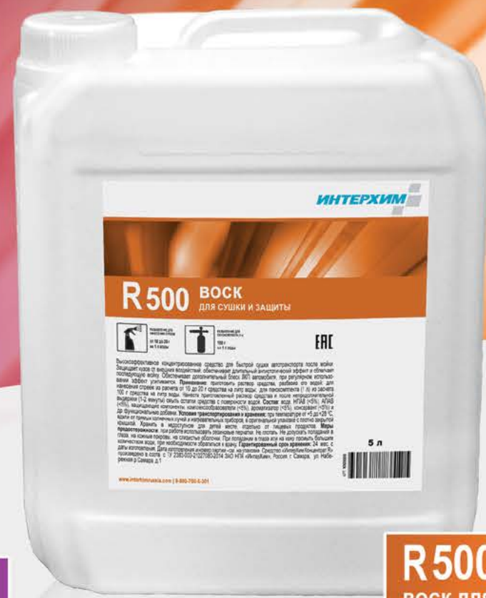
R500 ВОСК для сушки и защиты

Воск с гидрофобным эффектом для быстрой сушки поверхности автомобиля после мойки. Обеспечивает антистатический эффект, усиливает блеск ЛКП автомобиля. Разбавление: при нанесении спреем 20-40 г на 1 л воды, при нанесении пенокомплексом 150-250 г на 1 л воды.