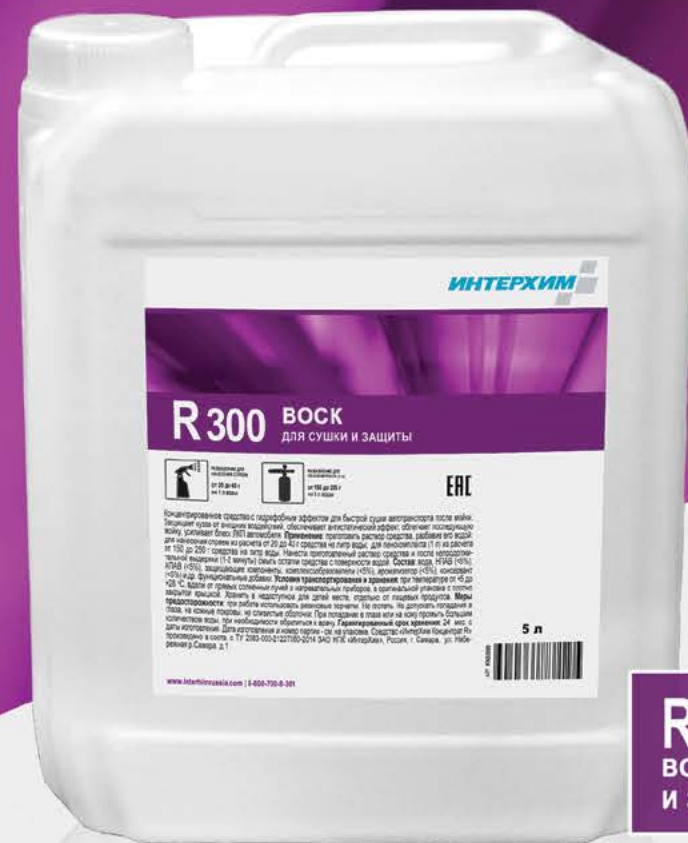
R300 ВОСК для сушки и защиты