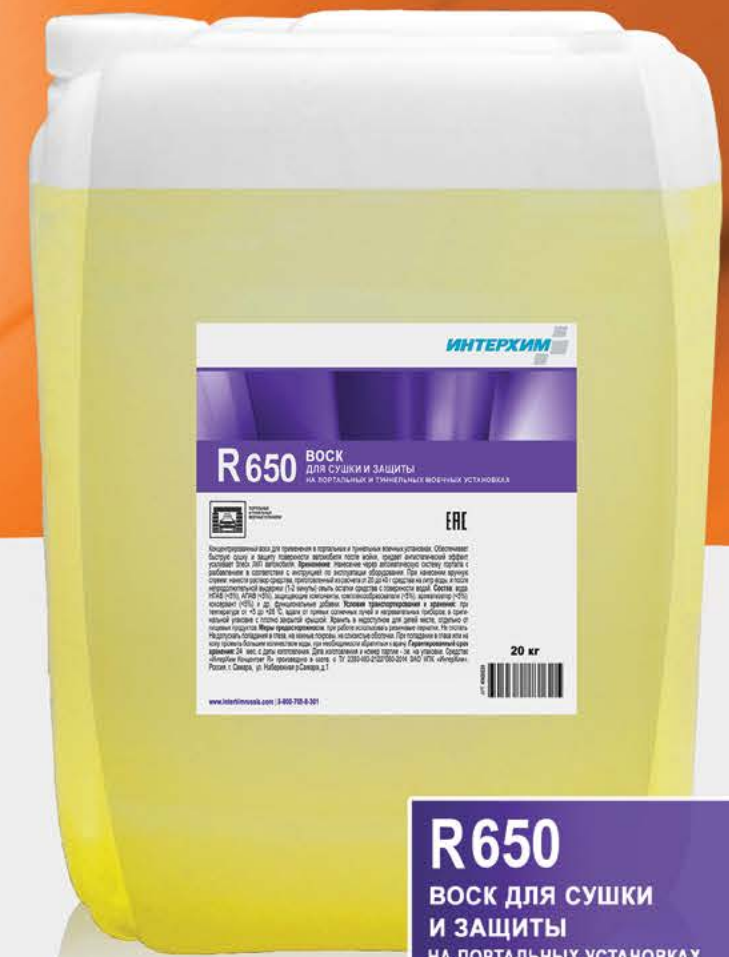
R650 ВОСК для сушки и защиты на порталных установках

Воск для быстрой сушки с усиленным защитным эффектом. Формирует на поверхности кузова пленку, которая защищает кузов от внешних воздействий, обеспечивает длительный антистатический эффект и облегчает последующую мойку. Обеспечивает дополнительный блеск ЛКП автомобиля, при регулярном использовании эффект усиливается. Разбавление: при нанесении спреем 10-20 г на 1 л воды, при нанесении пенокомплексом 100 г на 1 л воды.