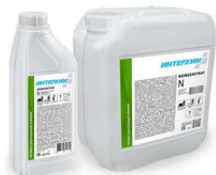
ИНТЕРХИМ Концентрат N Низкопенный концентрат нейтрального средства очистки

ИНТЕРХИМ 710 – нейтральное сильнопенное средство ухода за всеми водостойкими поверхностями без исключения. Средство по своему составу и свойствам идентично продукту ИНТЕРХИМ Концентрат U-Gel , однако отличается от него введением в состав специальных защитных водорастворимых полимеров, которые после нанесения на очищаемую поверхность оставляют на поверхности тончайшую защитную пленку (эффект микро-защиты), повышающую блеск вымытой поверхности и обеспечивающую дополнительное грязеотталкивание и дополнительную защиту от липких загрязнений, что облегчает последующую мойку покрытия. Защитная пленка при каждом применении средства обновляется – прежняя пленка растворяется и на ее месте формируется новая.