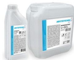
ИНТЕРХИМ Концентрат U-Gel Гель-концентрат универсального средства очистки