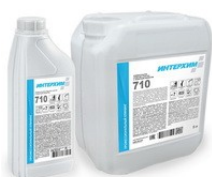
ИНТЕРХИМ 710 Универсальное средство очистки с защитным эффектом